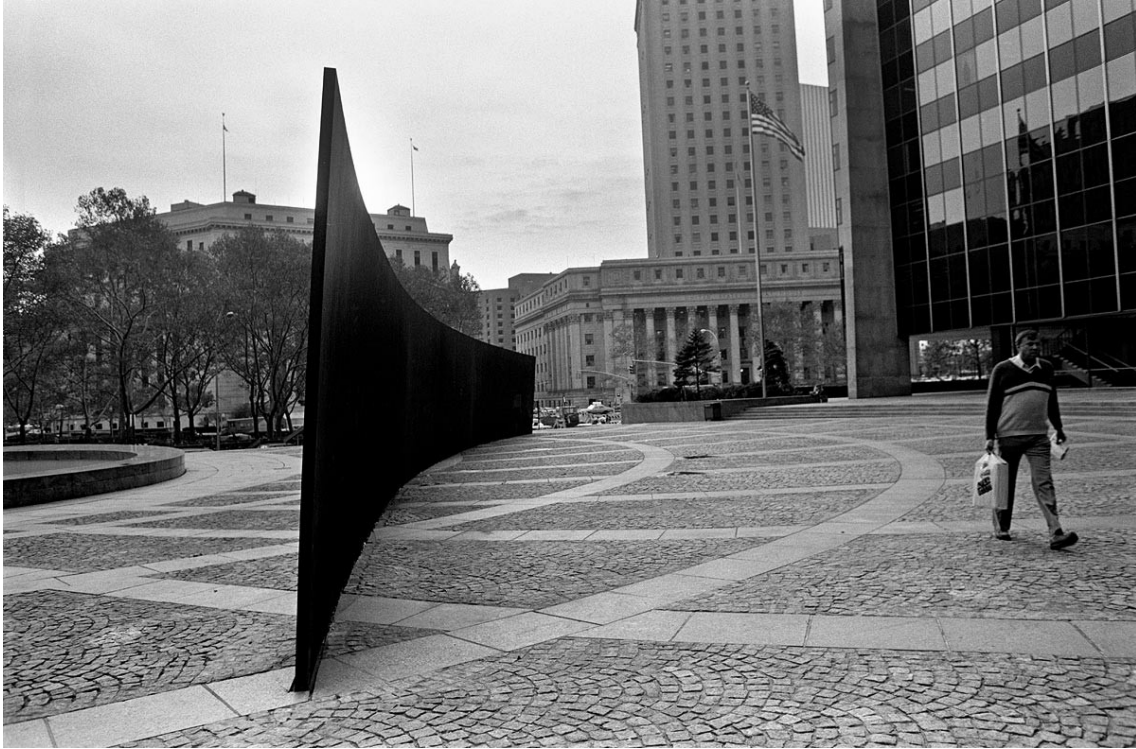
New York, Federal Plaza with Richard's Serra Tilted Arc , 1981 (dismantled in 1989), Corten steel.

Scuola Normale Superiore von Pisa in Cortona, Italien, 12.-17. Mai 2025