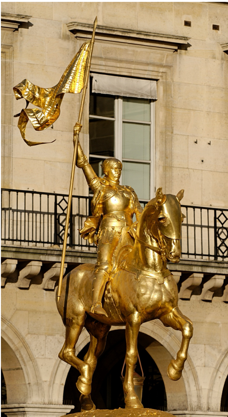
Emmanuel Frémiet, Equestrian monument of Joan of Arc , 1874, gilded bronze. Paris, Place des Pyramides.

The 23rd École de Printemps (EdP) will be held at the Palazzone di Cortona (one of the auxiliary sites of the Scuola Normale Superiore di Pisa) in Italy, from May 12th to 17th, 2025. PhD students and post-docs are invited to propose a paper related to this École's theme, which will be Monumentum/monimentum.