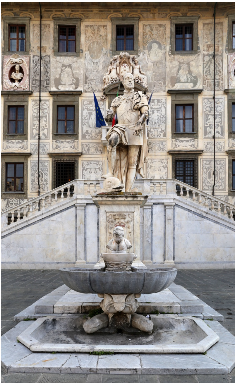
Pietro Francavilla, Cosimo I de' Medici and Fontana del Fantoccio , 1594-1600, marble. Pisa, Piazza dei Cavalieri.

La XXIII École de Printemps (EdP) si terrà presso il Palazzone di Cortona (una delle sedi periferiche della Scuola Normale Superiore di Pisa) in Italia, dal 12 al 17 maggio 2025. Dottorande/i e post-doc possono proporre un contributo inerente al tema di questa edizione: Monumentum/monimentum.