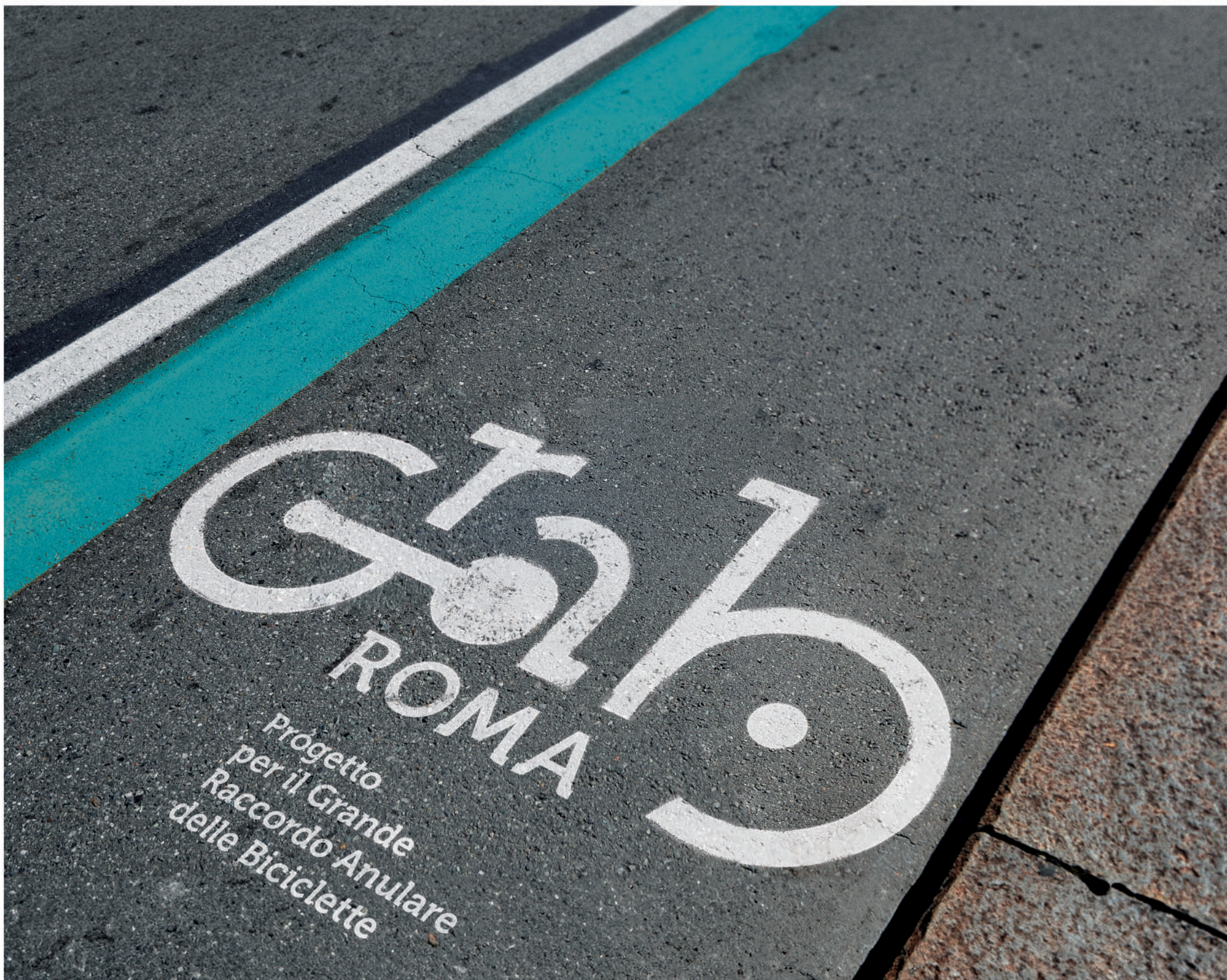
Immagine di Design Thinking